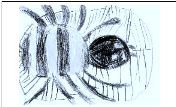
Roman Fučík, 1. třída