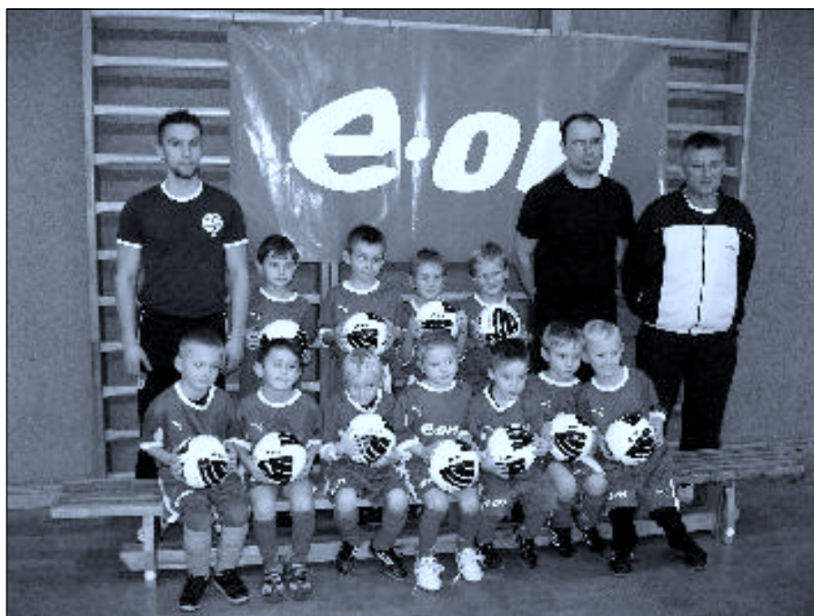
„BABY - CUP“ – turnaj nejmladších přípravky