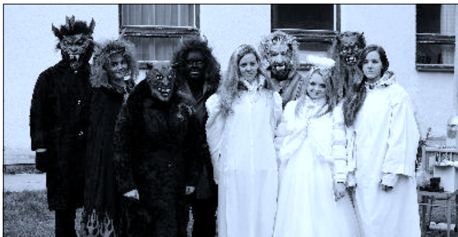
Čertovské odpoledne 1.12.2013 (více na str. 7)