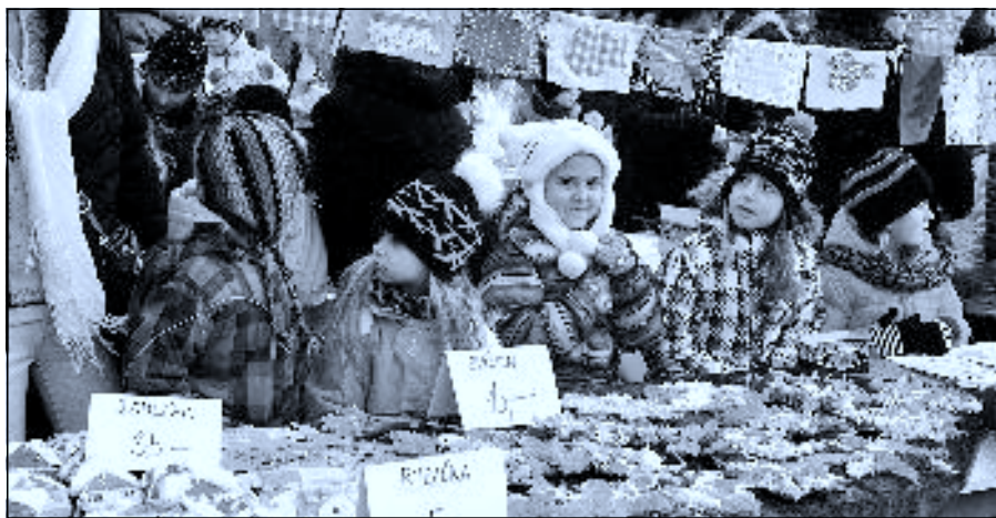
Vánoční jarmark 14.12.2013 (více na str. 6)