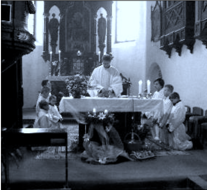
Mikulášská poutní slavnost v neděli 8. 12. 2013