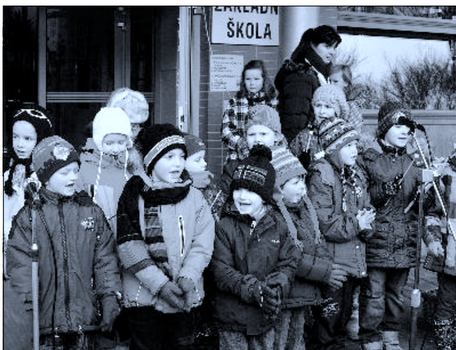
Vánoční jarmark 14.12.2013 (více na str. 6)