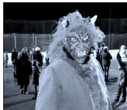
Peklo na hokejbalu 5.12.2013 (více na str. 7)