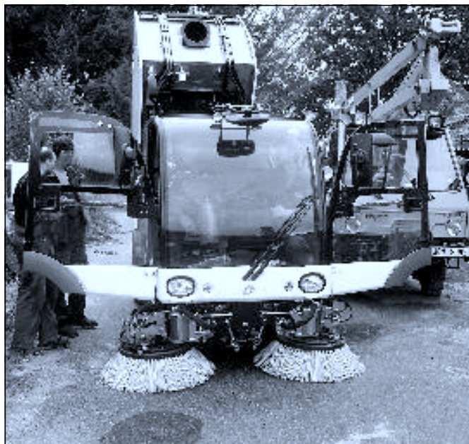
Nový samosběrný zametací vůz Mathieu Azura MC 200

Věříme, že tento stroj přispěje k větší čistotě a pořádku v našem městě.