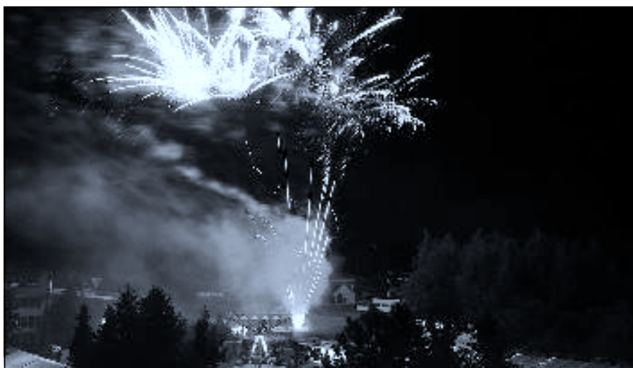
Suchdolská pouť – ohňostroj