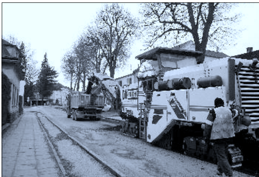
2. část rekonstrukce ulice 28. října začala v pondělí 18.3.2013 frézováním asfaltového povrchu vozovky