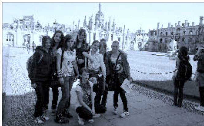
Cambridge – Nádvoří King's College

Ráno jsme se rozloučili, vše zase naskládali do našeho autobusu a zbýval nám poslední bod našeho programu – Londýn. A nastal celodenní maratón poznávání hlavního města Spojeného království Velké Británie a Severního Irsku. Prohlídku jsme začali z ptačí perspektivy –