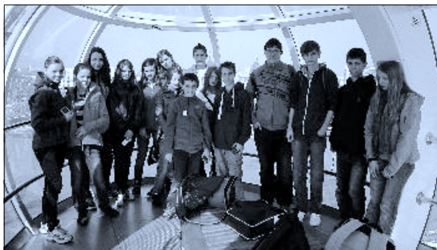
Londýn – London Eye (Uvnitř oka)