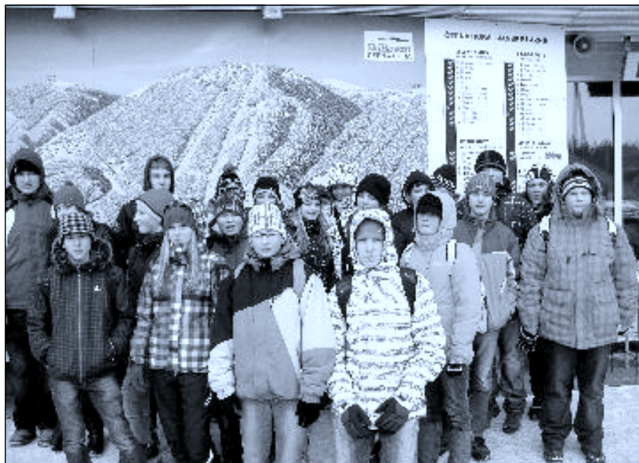
U kabinkové lanovky v Janských Lázních

Ve zdraví jsme přežili první výcvikové odpoledne. Vyslechli jsme přednášku horské služby se zajímavým vyprávěním a promítáním krkonošských panoramat. V neděli jsme zakoupili permanentky a vyrazili jsme si na první jízdu na pomě. Opět bylo trochu veselo,