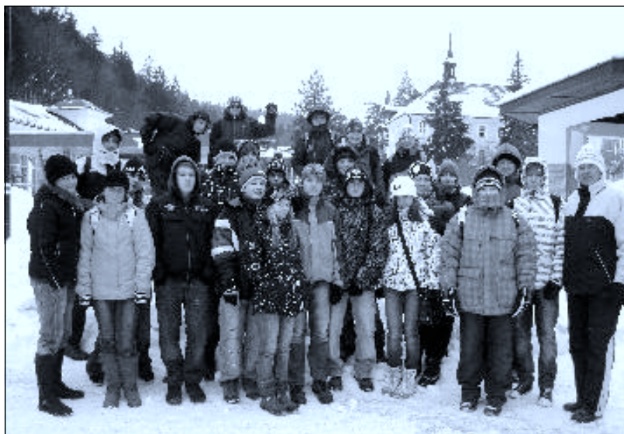
Na kolonádě v Janských Lázních