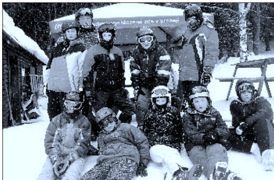
Na sjezdovce Košťálka