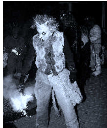
„PRAVĚ PEKLO“ – 5. prosince 2011