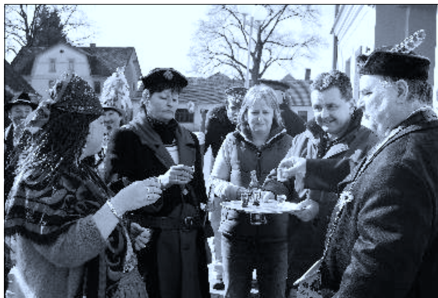
12.3.2011 Obec Baráčníků obnovila v Suchdole nad Lužnicí masopustní průvod

Výbor Mysliveckého sdružení „Suchdol“, o.s.