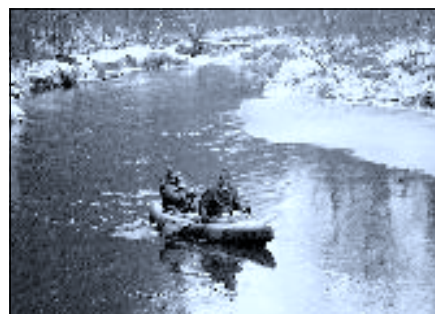
Vánoční jízda po Lužnici 25.12.2010