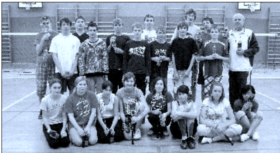
Účastníci turnaje v badmintonu

A nesmíme zapomenout ani na jednu z nej- větších sportovních akcí II. stupně, a tou byl