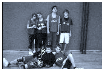
Turnaj ve florbalu – vítězné družstvo 8. ročníku