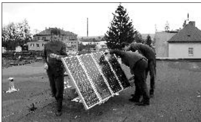
Instalace fotovoltaické elektrárny

ČSŽ v Suchdole pořádá v RESTAURACI U PÁVKŮ tradiční